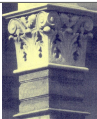
Detaliu partea superioară

Lozinca populistă lansată de Lenin, „ pace și pământ ” 3 , a făcut ravagii, soldații devenind subit bolșevici cu numele, dar în realitate, delincvenți de cea mai joasă speță.