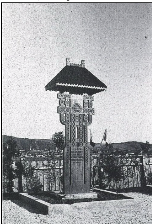
Troița din cimitirul eroilor din Bistrița