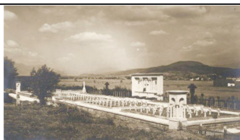
Vedere din latura dreapta, 1940