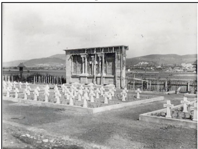
Cimitirul eroilor din Bistrița în timpul lucrărilor de amenajare

În Însemnări pentru urmași , preotul Oniga Pompei relatează pe larg împrejurările în care a ajuns în decembrie 1930 la Bistrița, numit confesor al garnizoanei, când „pentru îndeplinirea misiunii mele de preot nu aveam nimic, nici cel puțin un patrafir (epitrahil, n.n.) – pe care l-am împrumutat de la biserica din localitate” 8 . Nici capela militară nu exista, iar cimitirul eroilor „lăsa mult de dorit” 9 . A purces cu mare râvnă (avea împliniți 28 de ani) la realizarea celor de trebuință pentru îndeplinirea misiunii sale, reușind în câțiva ani, ajutat de comandantul garnizoanei, de ofițerii de acolo și familiile lor, să amenajeze capela militară într-o sală mare pusă la dispoziție,