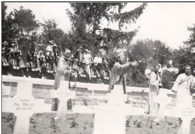
Sfințirea cimitirului eroilor din Bistrița

procesiune, participanții la Sfânta Liturghie au străbătut pe jos distanța de la Catedrală la cimitir. La cimitir, în fața monumentului s-a săvârșit parastasul pentru eroi, în urma căruia Episcopul Armatei, Partenie Ciopron, a stropit cu agheasmă, atât osuarul cu