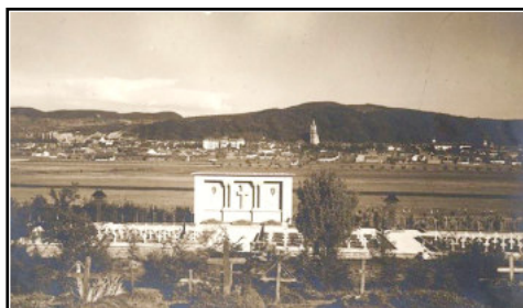
Vedere frontală, 1940