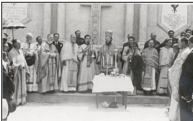
Slujba religioasă oficiată la inaugurarea cimitirului eroilor, 28 august 1938

Deja în vara anului 1938, după mai bine de trei ani, cimitirul eroilor din orașul Bistrița era gata pentru a fi sfințit. Sfințirea cimitirului s-a