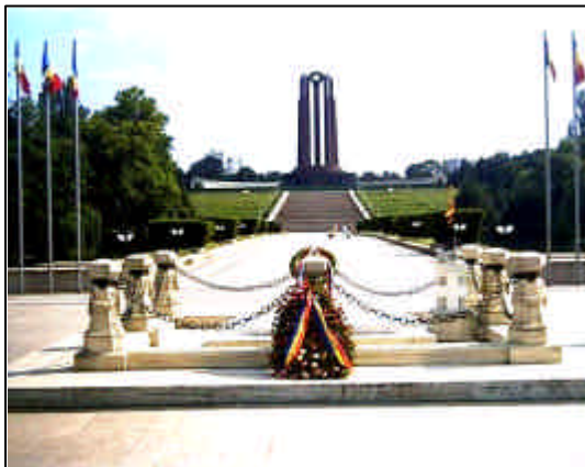
Mormântul Ostașului Necunoscut (București, Parcul Carol)

ONCE este continuatorul activității Asezământului Național Regina Maria pentru Cultul Eroilor, a cărei activitate a fost abuziv întreruptă prin Decretul nr. 71 din 1948.